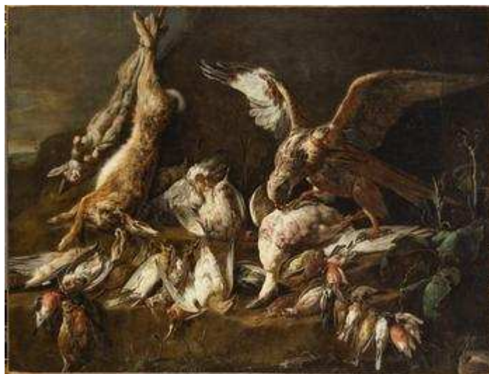
Adriaen van Utrecht: Jagdbeute von unterschiedlicher Qualität (2010)